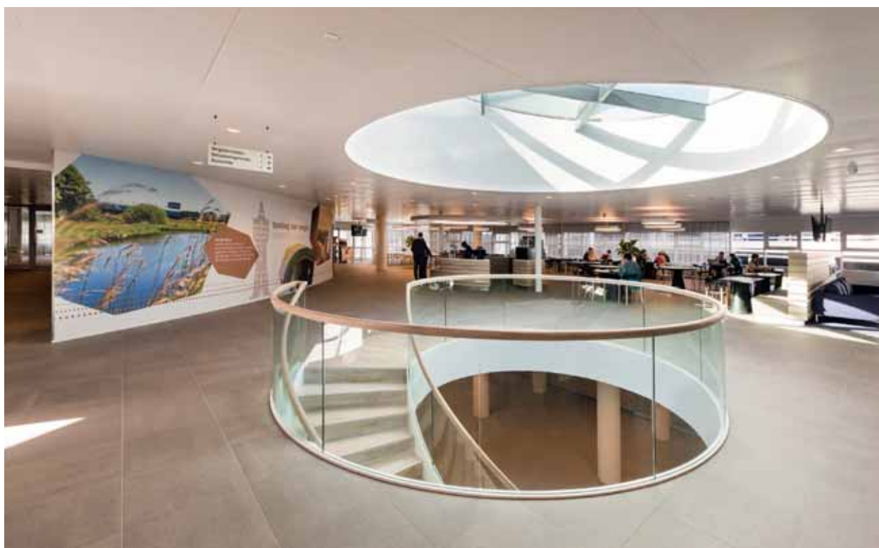
FOTO BOVEN De centrale trap met daklicht vormt de verbinding tussen ontmoetingsplein en vergadercentrum.