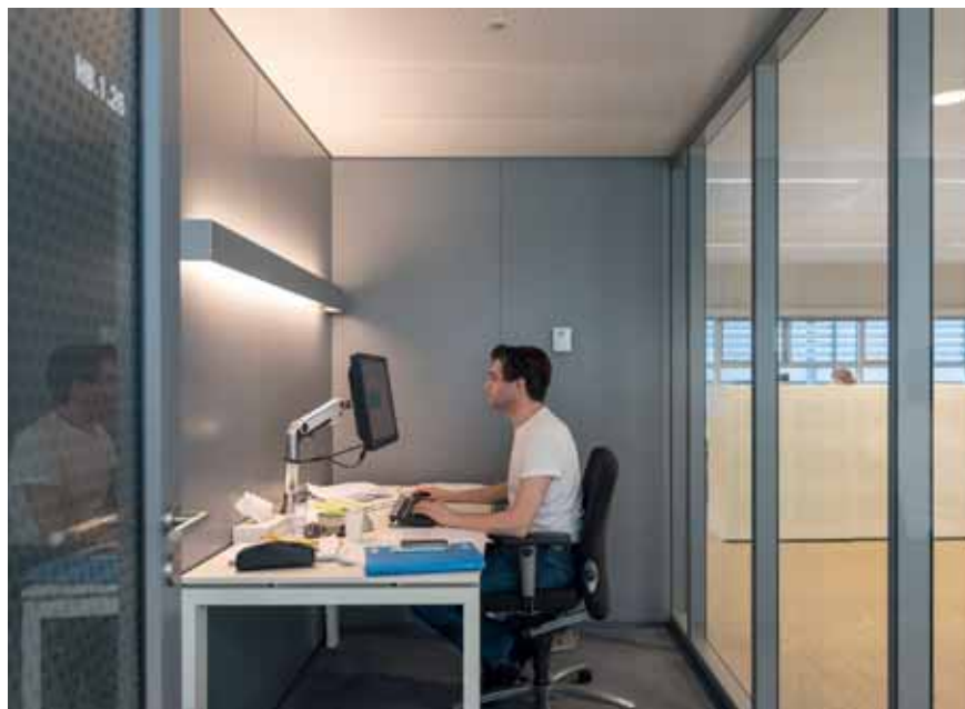
FOTO ONDER Er was veel aandacht voor de akoestiek: zo zijn veel werkplekken voorzien van geluiddempende schermen.

RECHTSBOVEN Plattegrond eerste verdieping.