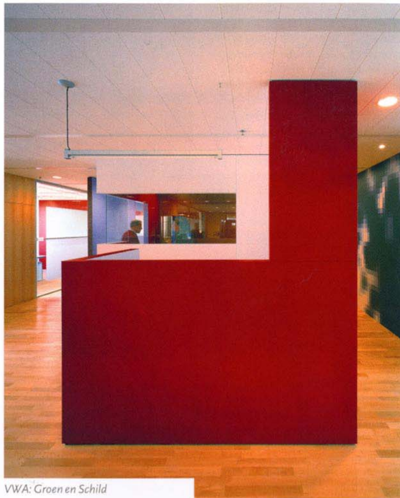
VWA: Groen en Schild